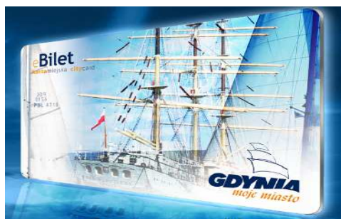
Karta ZKM w Gdyni