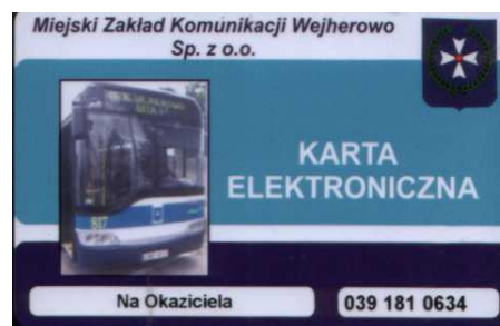
Karta MZK w Wejherowie